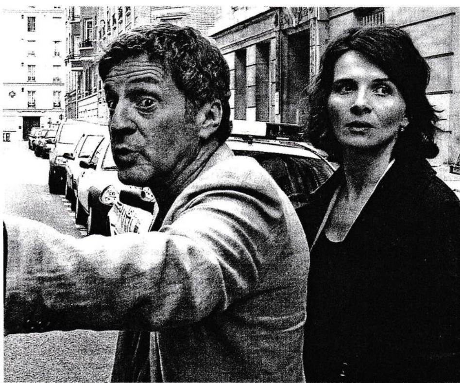
Lebensangst Daniel Auteuil (Mi.) und Juliette Binoche in Hanekes „Caché“