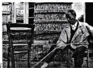
„Die Ausgesperrten“ (1982)